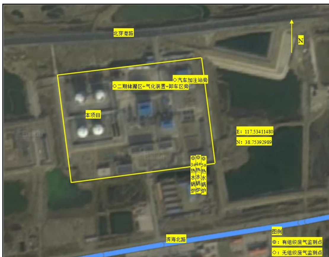
图7.2-1监测点位示意图